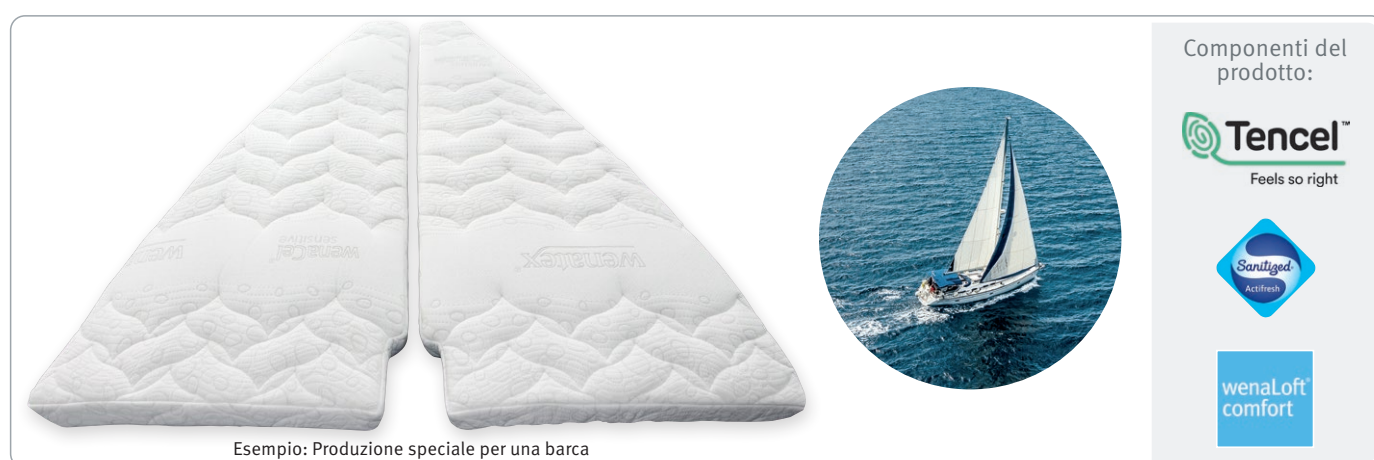
Esempio: Produzione speciale per una barca

Realizziamo i nostri materassi wenaCel® sensitive in qualsiasi forma e misura- così avrete un sonno sano e confortevole anche in vacanza. Come produttori potremo realizzarvi qualsiasi forma: rotonda, smussata o di taglio particolare.