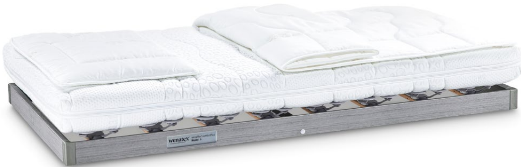
Foto simbolo wenaCel® comfortPlus Sistema letto ortopedico per neonati e bambini

Un sonno rigenerante è della massima importanza per la salute del vostro bambino. Per questo è indispensabile scegliere un sistema letto che soddisfi perfettamente le esigenze di neonati e bambini. Il sistema letto wenaCel® comfortPlus è, insieme all'orsacchiotto e alla copertina, un compagno ideale per tutta la notte.